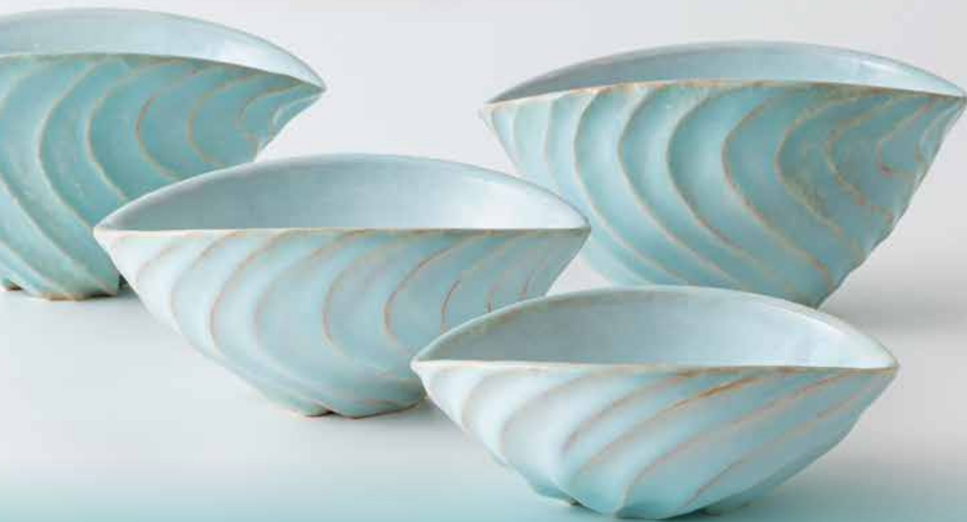
上=伴裕子《はるかぜ》下=岡田泰《北の海》